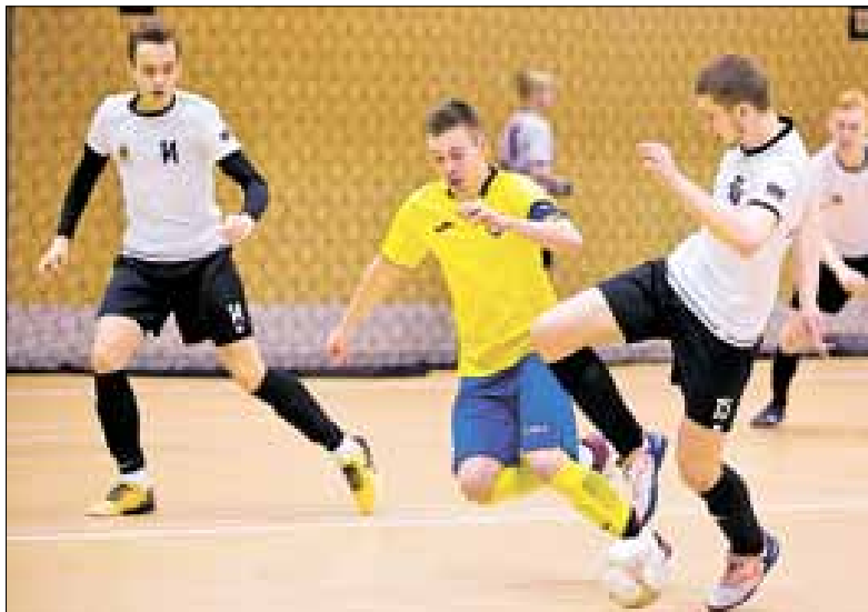
■ Финал: «Водник» – СШ Коми-2001.