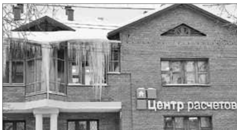
■ ул. Поморская, 41