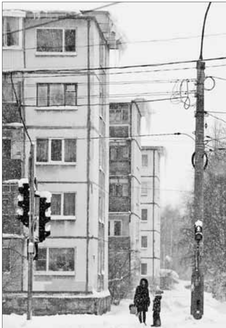
■ ул. Красных Партизан, 18, 20

Таких примеров по городу – сотни. На Поморской, 41, например, ледяные сосульки прекрасно заменяют собой жалюзи: они настолько длинные, что улицу из окон здания вряд ли видно. На Комсомольской, 10/2