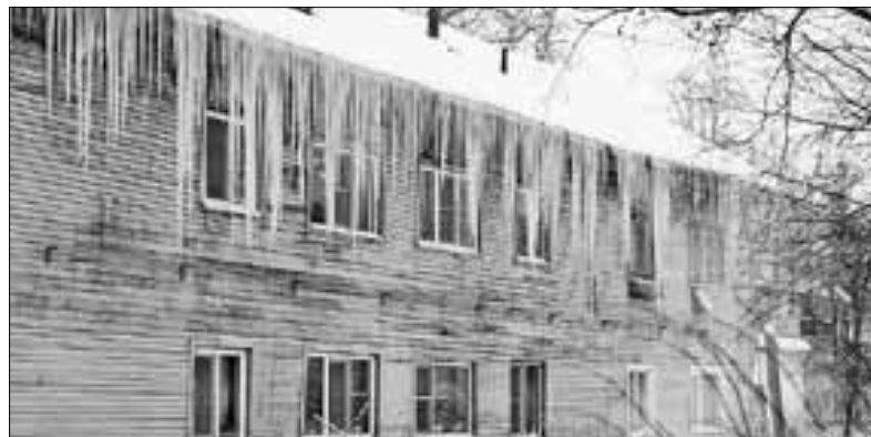
■ ул. Комсомольская, 10, корп. 2

А лучше всего при обнаружении угрожающего вида сосуллек, висящих на крыше дома, позвонить (или написать) в обслуживающую организацию (управляющую компанию или ТСЖ): она обязана отреагировать оперативно. Если реакции не последует, обращайтесь в управление муниципального жилищного контроля администрации города по телефонам 606-793 или 606-792.