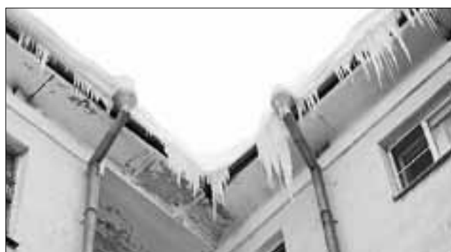
■ пр. Троицкий, 61