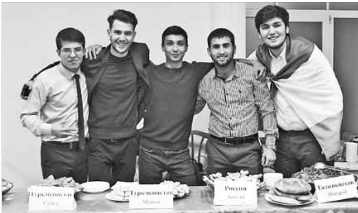
■ Архангельск – город многонациональный. Это еще раз доказал фестиваль «Помор фест» в САФУ в ноябре прошлого года.

Депутаты городской Думы поддерживают все общественные объединения, мы со всеми встречаемся, со всеми работаем, выделяем им помещения для встреч, проведения собраний. Ветераны, семьи