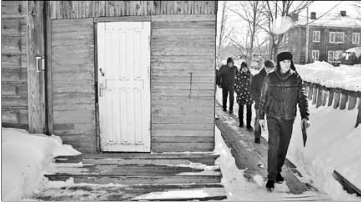
■ В 2018 году специалисты управления муниципального жилищконтроля проверили работу порядка 60 процентов УК.

Одной из причин резкого увеличения контрольных мероприятий является наделение муниципалитета отдельными государственными полномочиями по лицензионному контролю в сфере предпринимательской деятельности по управлению многоквартирными домами. Соответствующий закон был принят областным Собранием депутатов в конце 2018 года. Все необходимые муниципальные правовые акты утверждены, а работает Управление муниципального жилищного контроля в рамках межведомственного взаимодействия с Государственной жилищной инспекцией Архангельской области.