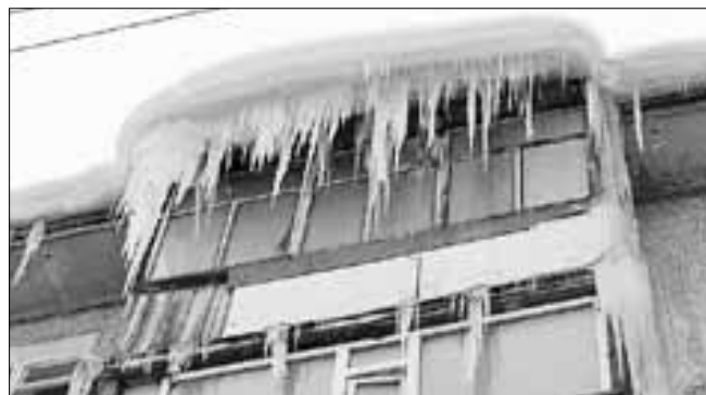
■ ул. Тимме, 17