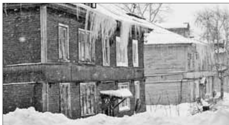
■ ул. Красных Партизан, 30

« МЧС советует: если во время движения по тротуару вы услышали наверху подозрительный шум, ни в коем случае не останавливайтесь, не поднимайте голову, чтобы рассмотреть летящие сверху сосульки. Лучше как можно скорее прижмитесь к стене: если это действительно сход снега, козырек крыши послужит укрытием